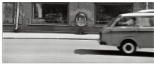
Brīvības iela 1992