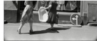
Arvīdu iela 1993