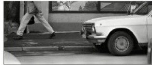
Lāčplieņu iela 1992