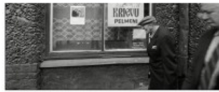
Stacijas iela 1991